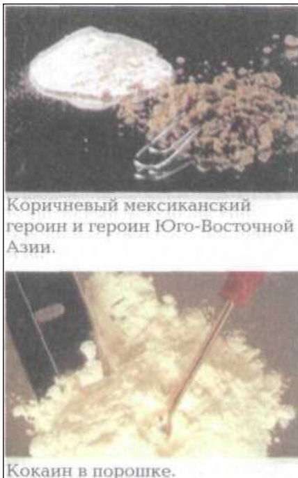
Коричневый мексиканский героин и героин Юго-Восточной Азии.